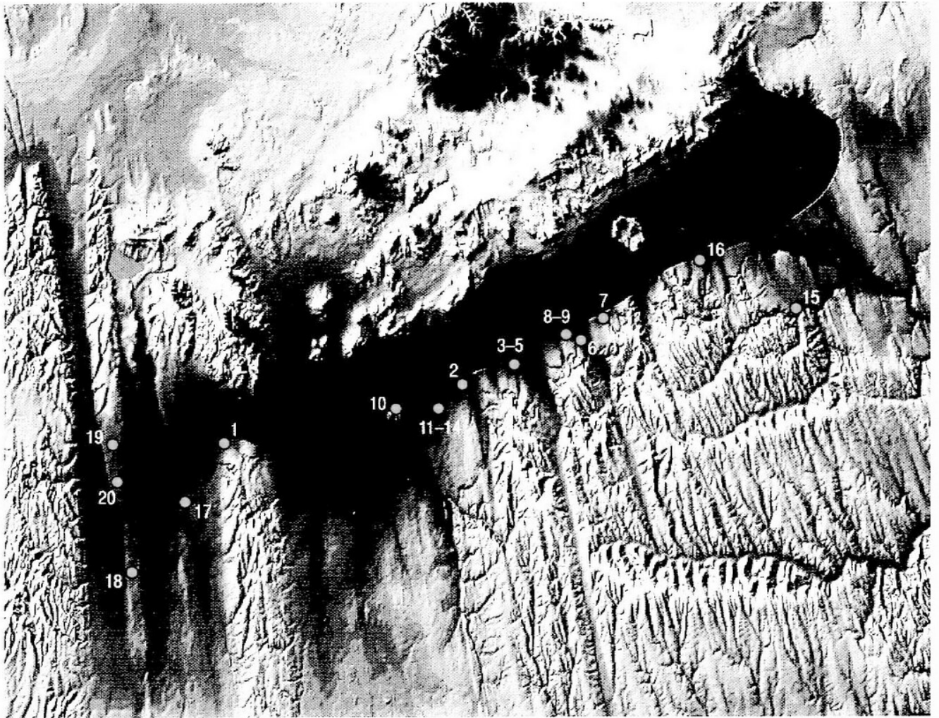
15. kép A tanulmány szövegében említett dél-balatoni rézkori lelőhelyek