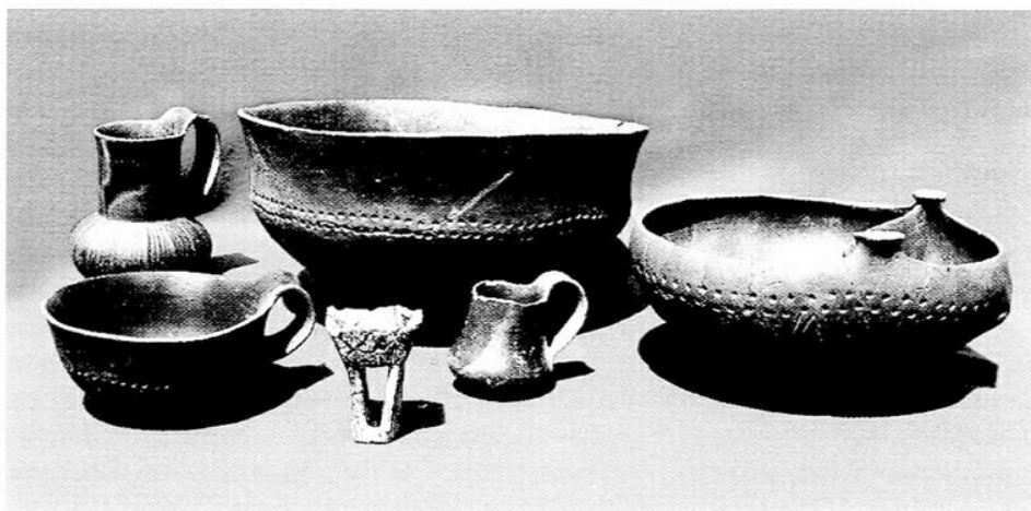
12. kép Késő rézkori sír mellékletei Balatonlelle-Felső- Gamászról (291. sír)