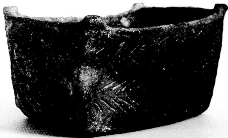
13. kép A badeni kultúra kocsimodellje Boglárlelléről

művelés és háziipar mellett az állattartás is jelentős volt: a sertés, juh és kecske mellett a szarvasmarhatartás volt a jellemző. Táplálékukat a vadászatokon elejtett állatok, valamint halak és kagylók is gazdagították. Új jelenség, hogy a Kárpát-medencében megjelenik egy, kizárólag a gyapjáért tartott juh fajta, amely a kereskedelem egyik fontos tényezője lehetett, és az időjárás megváltozására is következtetni enged.