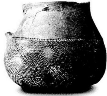
9. kép Tűzdelt barázdadíszes bögre Ordacsehi-Bugaszegről

A szlovákiai névadó lelőhelyről elnevezett bolerázi csoport már a badeni kultúra korai időszaka. A badeni kultúra hosszú, békés fejlődése során létrejön az őskor egyik legizgalmasabb kultúrkomplexuma. Nagy területen, Európa déli és középső régiójában (Bulgária, Románia és az egykori Jugoszlávia, valamint a mai Magyarország, Ausztria, Svájc, Csehország, Szlovákia, Kis-Lengyelország és Németország déli területein) található meg lelőhelyei. A törté-