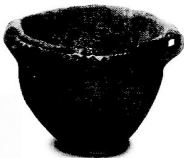
11. kép A bolerázi csoport edénye Zamárdi-Kútvölgyi-dűlőből

A későbbiekben az edények jellemzője a különböző pontbenyomkodással, bekarcolással kialakított gazdag díszítés. Az edénykészletben megtalálhatók a nagyméretű tárolóedények, a bordadíszes fazekak, kisebb-nagyobb tálak, a nagyméretű, szépen kidolgozott kancsók, a kultúrára jellemző magas fülű merítőedények, szószos edények (12. kép). A badeni kultúra jellegzetes tárgyai még a díszes, gyakran vörösre festett talpas serlegek és a belül egyharmad-kétharmad arányban kettéosztott, ún. kétosztású tálak (12. kép; ld. még 140. kép). Az M7-es autópálya-átsátásokon több, a kultúra későbbi időszakába sorolható település is előkerült (Balatonőszöd-Temetői-dűlő, Balatonlelle-Országúti-dűlő, Balatonboglár-Berekre-dűlő, Balatonszemes-Szemesi-berek, Ordacsehi-Bugaszeg, Ordacsehi-Major). A kultúra népének életében a föld-