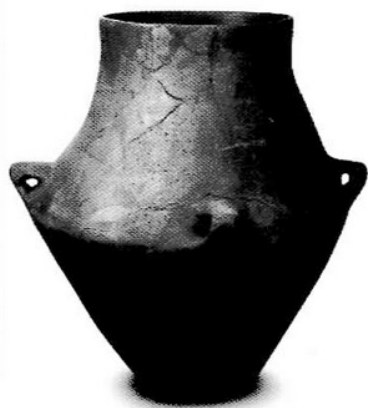
7. kép Középső rézkori tárolóedény Balatonszemes-Bagódombról