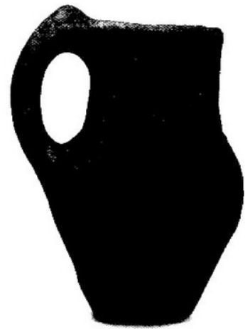
10. kép Tűzdelt barázdadíszes korsó Balatonboglár-Berekre- dűlőből