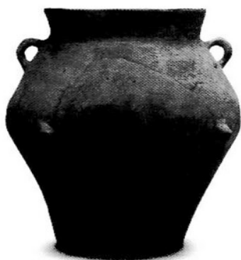
8. kép Középső rézkori edény Balatonboglár-Borkombinát lelőhelyről

szerint bal, illetve jobb oldalra fektetve tették a sírba. A temetkezés során edényekben ételt-italt helyeztek az elhunytak mellé. Területünkön a rézkorba keltezhető lengyeli kultúrák temetkezését nem ismerünk.